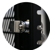
Chapa de seguridad