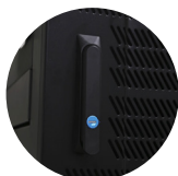
Chapa de seguridad