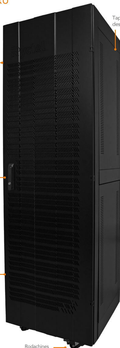
Tapa lateral desmontable