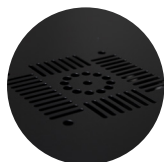
Ventanas de ventilación